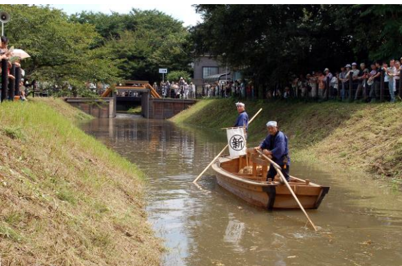
再整備された見沼通船堀で毎年行われる実演