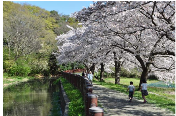
開削時の原風景が残る見沼代用水原形保全区分間